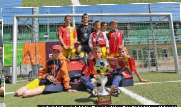
REPREZENTACJA ŁĘGOWA (GMINA PRUSZCZ GD.) – II M-CE