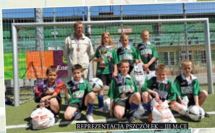
REPREZENTACJA PSZCZÓŁEK – III M-CE