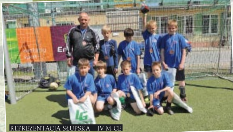
REPREZENTACJA SŁUPSKA – IV M-CE