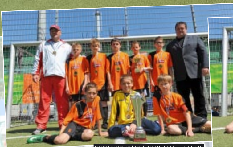
REPREZENTACJA ELBLĄGA – I M-CE