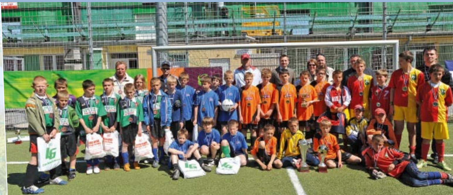
SUPERFINALIŚCI I OGÓLNOPOLSKIEGO TURNIEJU Euro Sea 2009